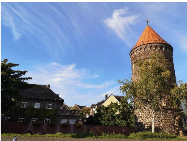
Der Siebenteufelsturm von Haltern