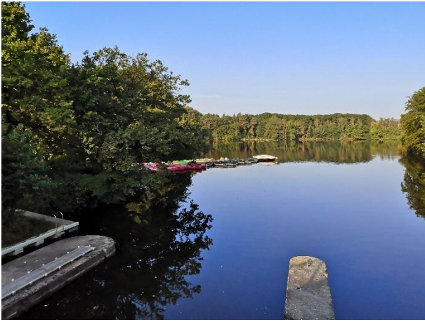
Der Stausee in Haltern