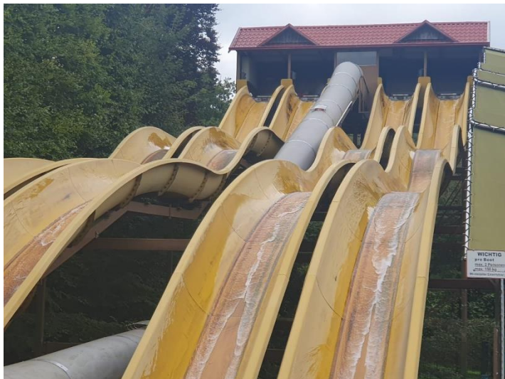
Die Wasserrutsche im Ketteler Hof