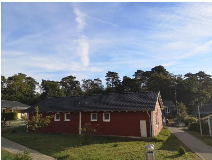
Hier haben wir geschlafen